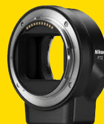
ΠΡΟΣΑΡΜΟΓΕΑΣ ΜΟΝΤΟΥΡΑΣ FTZ (JMA901DA)