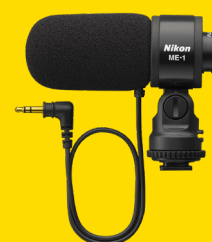
ΜΙΚΡΟΦΩΝΟ ME-1 (VBW30001)