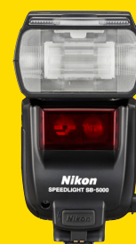
ΦΛΑΣ SPEEDLIGHT SB-5000 (FSA04301)